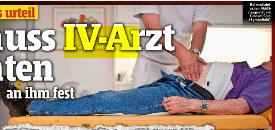
Bei medizinischen Abklärungen ist viel Geld im Spiel (Symbolbild).